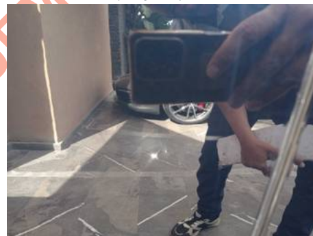
Porte avant gauche (Rayure)